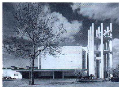
Gemeindeforum Stephanus, 1968